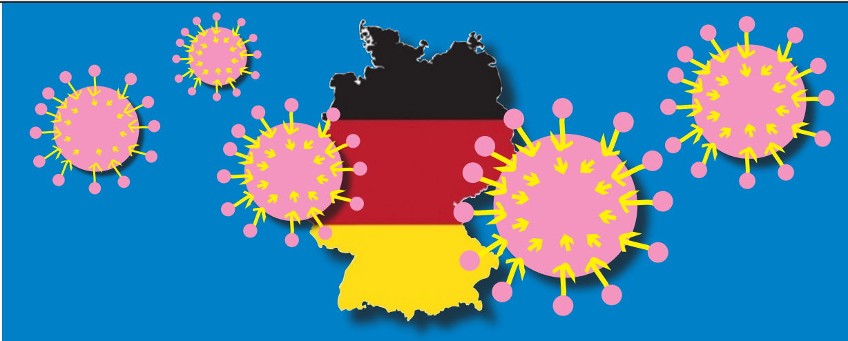
Illustration: Eva Neumann