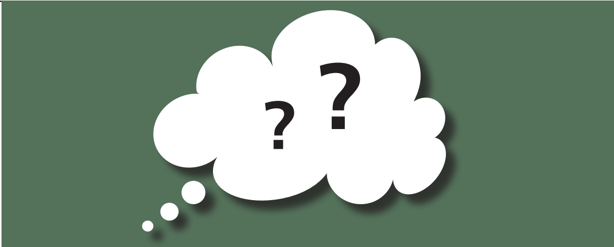
Illustration: Eva Neumann