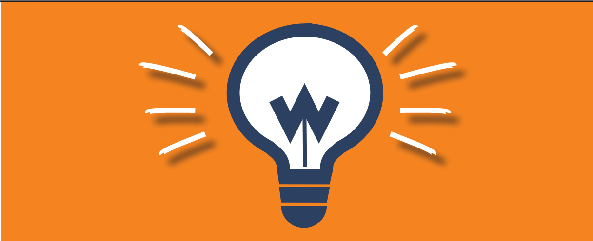
Illustration: Eva Neumann